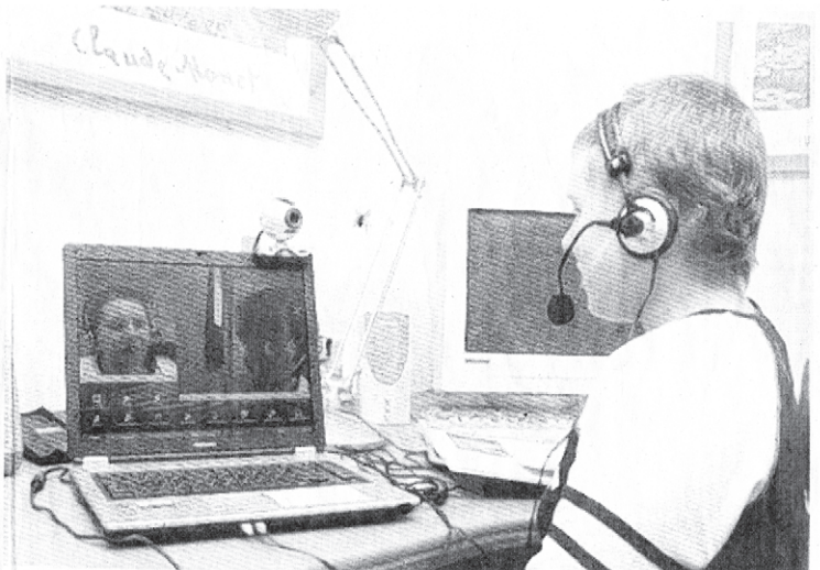
„Hallo, wie geht's euch?“ Per Mausclick ist der Patient mit der Schulklasse verbunden.